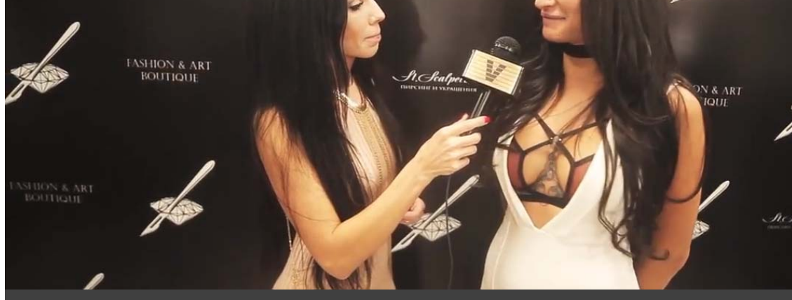
Открытие St.Scalpelburg глазами Vklybe.TV

P.S. И не забывайте про новый адрес (Лиговский, 37): мы сами по привычке всё ещё сворачиваем в сторону бывшего расположения студии.